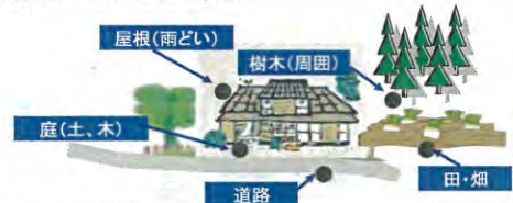
詳細モニタリングと除染