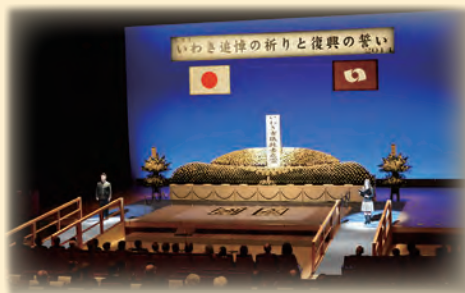
■写真 「2014 いわき追悼の祈りと復興の誓い」 〔平成26(2014)年3月9日〕