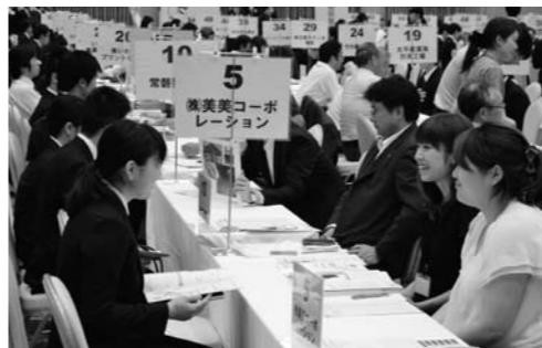
企業説明会（イメージ）

本市の将来を担う若年層のUIJターン促進や、早期からの地元就職への意識醸成のため、就職活動を開始する大学三年生などの卒業年次前の学生および保護者を対象とした合同企業説明会を開催します。 また、同説明会に参加する方向けに、東京からの就活バスも運行しますので、ぜひご参加ください ▼とき 3月16日（月） ①就職セミナー（※） 13時～13時50分