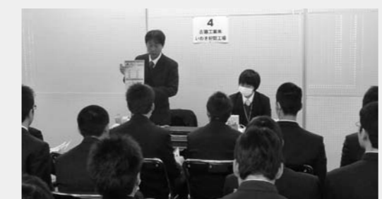
昨年度は市内13校の生徒812人が参加