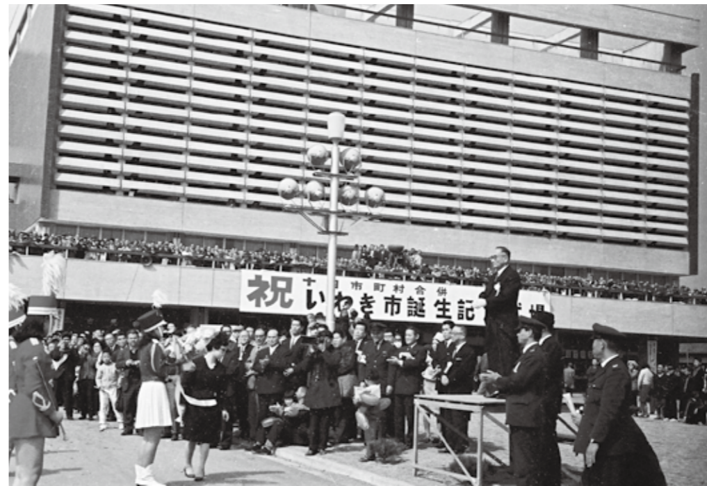
当時の平市民会館で開催したいわき市誕生記念式典

本市は、平成二十八年十月一日に市制施行五十周年を迎えます。この大きな節目を祝い、本市のさらなる飛躍・発展に向けた契機とするため、五十周年記念事業を実施します。市では昨年十二月に、同事業の基本方針を策定しました。また、広く市民の皆さんの提案を事業に反映するため、プレゼン大会を開催します。