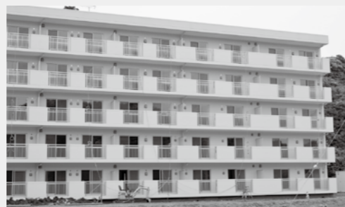
薄磯団地(平薄磯字北作)