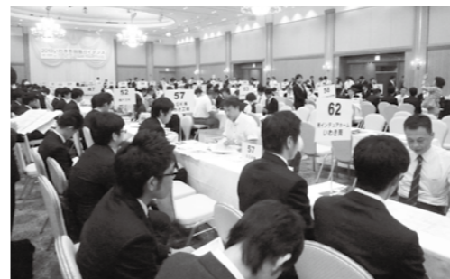
昨年度は求職者323人、企業64社が参加

一般求職者、UIJター ン希望者、大学等新卒予 定者と地元企業が一堂に会す る、市内最大規模の合同就 職説明会「いわき市就職ガ イダンス」を開催します。 今回は、市就職ガイダン スに参加する方のために、 東京からの就活バスも運 行します。この機会を活用し ぜひご参加ください。 ▼開催日時 7月11日(金) 10時30分～11時20分 ①就職セミナー(※) 11時40分～12時50分 ②参加企業による企業PR