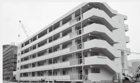
豊間団地(平豊間字榎町)