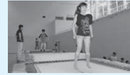
さまざまなスポーツ を体験

○シェイプアップトレーニング教室 日/時 4月21日・28日、5月19日・26日、 6月2日・23日・30日、7月7日・14 日・28日、8月4日・11日・25日、9月 1日・8日・29日、10月6日・20日・27 日、11月10日・17日、12月1日・8日の 月曜日/19時～21時 所 総合体育館 ○子どもの日に総合体育館を無料開放 日 5月5日(月) 10時 ～12時、13時～15時 内 トランポリンやバ ドミントン、スト ラックアウト、卓球 など