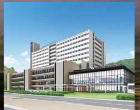
完成イメージ画像

市民の健康と生命を守るため、新病院が建設されます! 新病院は、「機能的で使いやすい」「災害に強い」などをコンセプトとしており安全で安心な医療を提供し、地域から信頼され進歩し続ける病院を目指します。