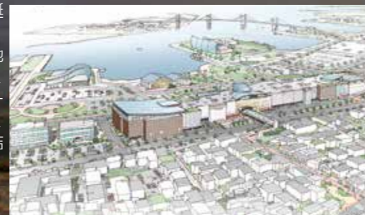
完成イメージ画像

「アクアマリンふくしま」や「いわき・ら・ら・ミュウ」などが立地し、いわきを代表する観光スポットである小名浜港周辺地域に、新たな都市拠点が誕生します。小名浜港背後地の開発に向け、市とイオンモール株式会社は、基本協定を締結しました。