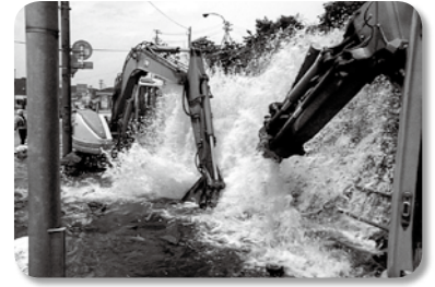
直径50cmの水道管の漏水事故

また漏水により、大切な水が無駄になったり、水圧が低下したり、水が出なくなるほか、道路の陥没などの二次災害を引き起こすこともあります。その対策として、早期の発見が重要なことから、水道局では「漏水調査」を実施しています。