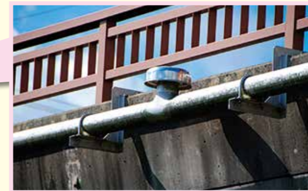
拡大すると…キノコみたいな形になっているよ