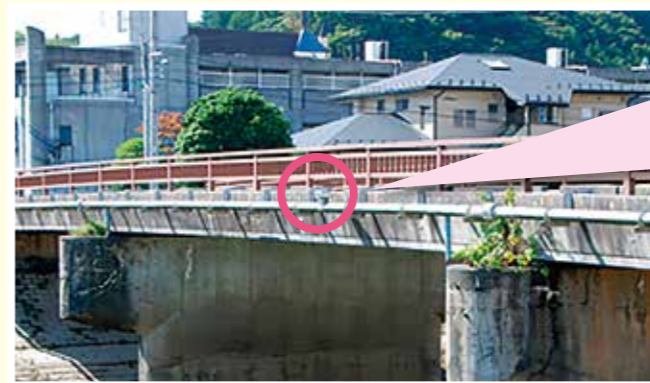
橋にある水道管 (水管橋) にもついているよ

このようなことから、水道管の高くなっている箇所に空気がたまり、それが原因で水が白くなったり、水の流れを邪魔したり、圧縮された空気によって水道管が壊れるなど水道管の中に溜まった空気は多くの障害をおこします。これらを防ぐため、写真のように水道管の高い箇所に空気弁を設置して空気を自動的に排気しています。