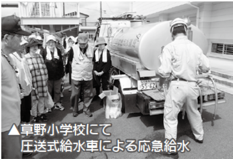
▲草野小学校にて 圧送式給水車による応急給水

今年の訓練は「大規模災害に備えた地域と学校等との連携強化」を目標に、市内27か所に避難所を設け、様々な訓練が実施されました。水道局では勿来第二中学校をはじめ主要避難所9か所に仮設給水所を設置し、応急給水訓練を行いました。