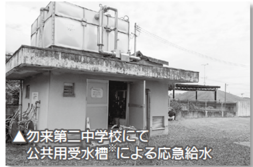
▲勿来第二中学校にて 公共用受水槽による応急給水