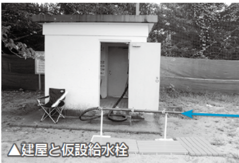
▲建屋と仮設給水栓

水道局では、非常時の飲料水を確保するため、市内22か所に「非常用地下貯水槽」を設置しています。貯水槽は地下に埋設され、平常時は、配水管の一部として常に水道水が流れていますが、非常時には、緊急遮断弁が作動し、貯水槽内に飲料水を確保します。その飲料水を手押ポンプでタンクにくみ上げ、仮設給水栓から給水します。