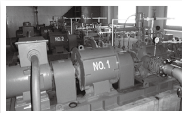
▲ ポンプ場の内部（ポンプ設備）