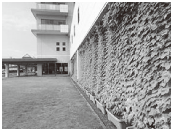
平成25年度緑のカーテンコンクール大賞 受賞者「社団医療法人呉羽会 呉羽総合病院」