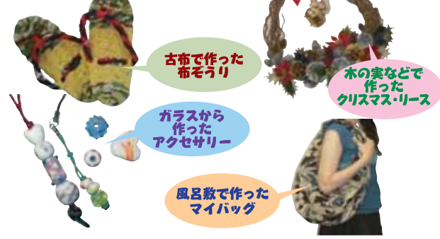
古布で作った布ぞうり