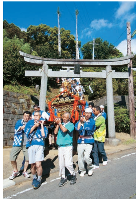
鹿島神社祭礼神輿