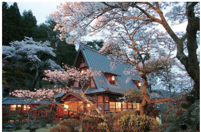
春の高野鉱泉の風景

高野地区等における農地や森林、河川等の景観の維持保全のため、それぞれの所有者、管理者との調整の上、具体的対策の内容を協働で検討し、進める。