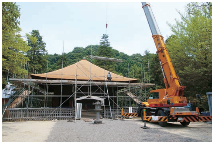
国宝白水阿弥陀堂の修復工事

人口減少により増加する空き地・空き家が環境や治安の悪化を招かないよう、その状況把握と管理方法、管理主体等のあり方を検討する。