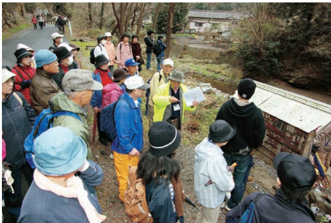
炭砦(ヤマ)の案内人の活動

地区の歴史への関心を高めるツアーイベントや、阿弥陀堂関連の交流イベント等を開催し、観光的アピールにもつなげる。