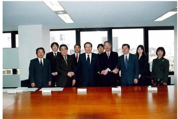
パートナーシップ協定締結式 (平成14年3月19日)