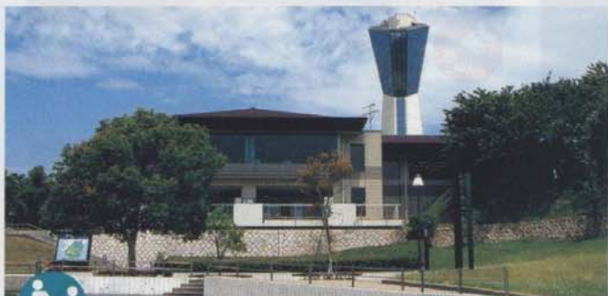
管理棟 レストラン・売店・ロビー・事務所があります。

「東北の湘南」といわれるいわき市は東北地方の最南部に位置し、気候温暖で豊かな自然と湯に恵まれ、国際港小名浜港を持つ近代都市として発展しています。 「いわきマリンタワー」はその国際港東端の岬、海上46mの台地に広がる、総面積700,000㎡の三崎公園一角に立つ塔屋59.99mの展望塔です。 海拔106mの展望室から、いわき一円が一望でき、屋上の「スカイデッキ」からは360度の大パノラマが広がり、潮風をうけながら非常にエキサイティングな体験ができます。 また、公園内には緑の芝生を敷きつめた広場と自然遊歩道があり、人気を集めている潮見台からは岩壁を洗う白波と、透き通った海底を眼下に望むことができます。