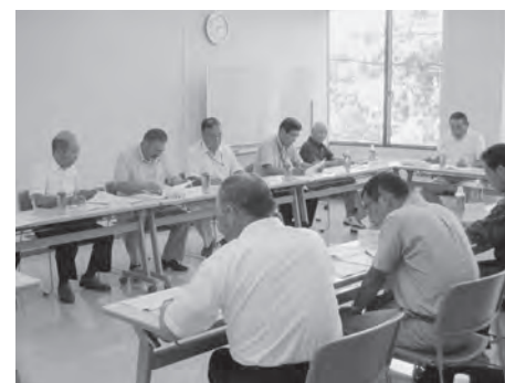
〔農地部会の審議風景〕