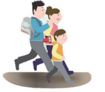
避難の呼びかけにはすみやかにしよう。

自分の家や生活する場所が浸水想定区域に入っていないとしても、決して安心できません。浸水想定区域内にお住まいの方はもちろんのこと、それ以外の場所にお住まいの方も、浸水に備えて事前に避難所や避難経路を確認しておきましょう。