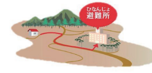
住んでいるところの避難所と避難経路を確認しておこう。