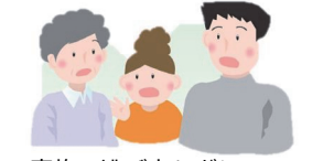
家族で逃げ方などについて話し合っておこう。