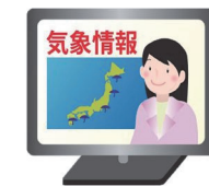
TVやラジオの情報に気をつけ、正確な情報収集を行おう。