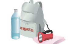
非常持ち出し袋を用意しておこう。