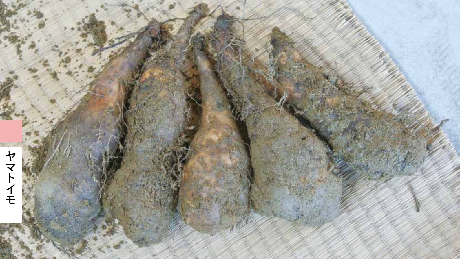
↑泉町産のヤマトイモ（猛暑の影響で全体的にイモが小ぶりの年となった）