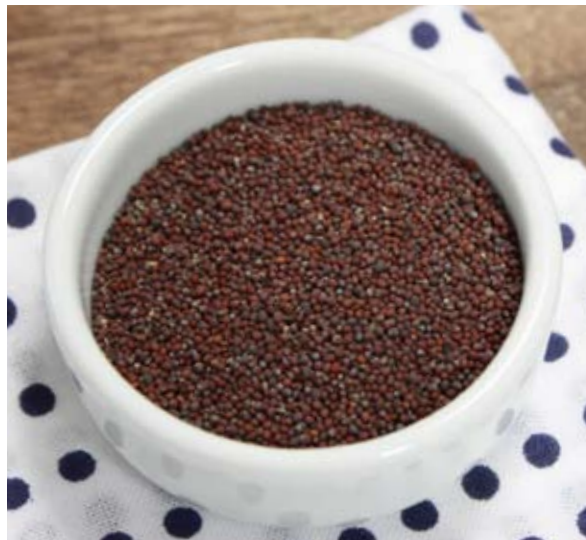
からしの原料にもなる、カラシナの種子

カラシナの一般的な調理法は「カラシナ漬け」で、3月下旬から4月下旬に収穫したカラシナで作られたものは「涙が流れるくらい辛い」といいます。その辛さは自家採種だから出せるのではないかと言う栽培者は、毎年「自家採種」にこだわって栽培を続け、「からしな漬け」を三和地区の直売所で販売しています。