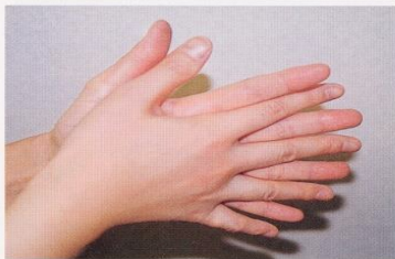
1. 手のひらを合わせ、よく洗う