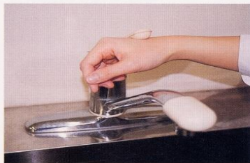
7. 水道の栓を止めるときは、手首か肘で止める。できないときは、ペーパータオルを使用して止める