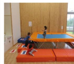
[ 活 動 の 様 子 ]